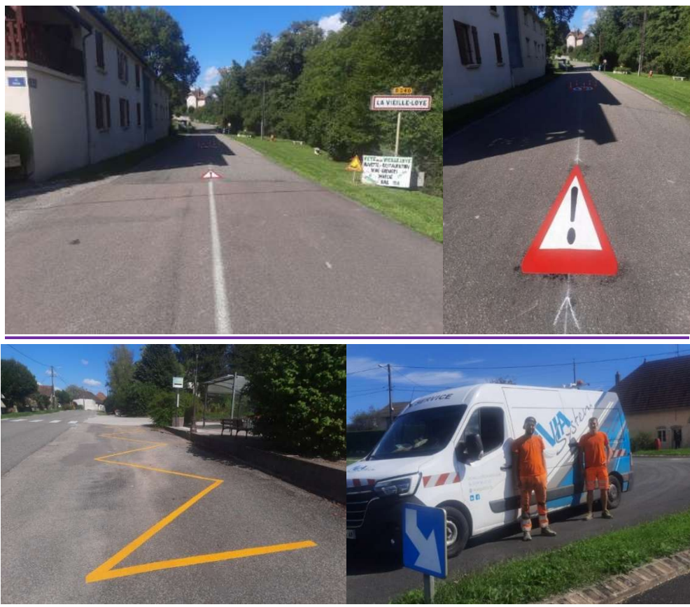
Remise à niveau des accotements rue des Tuots Baraques du 14 par Kévin