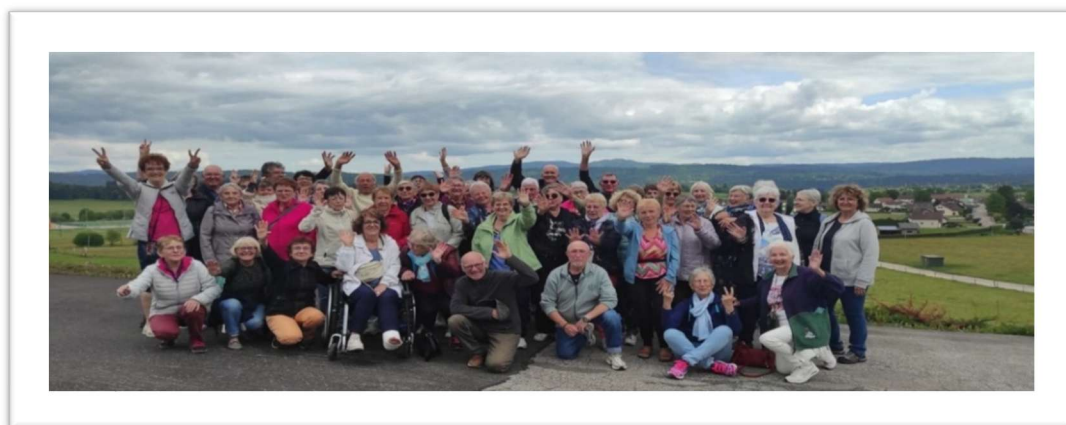
Court séjour à Villars le Lac en Mai 2025

Elle nous réserve aussi de bons moments de convivialité !